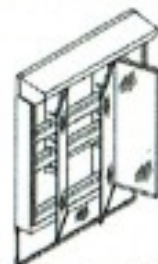
3面鏡(全収納・スタンダードLED) MGJ2-7531XS