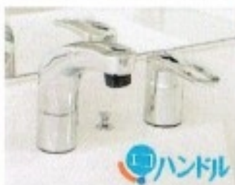
シングルレバーシャワー水栓